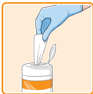
Prendre une lingette